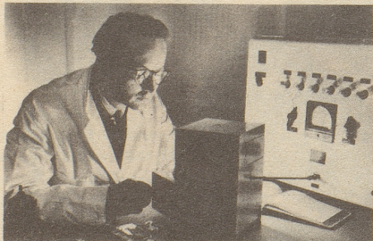
Wissenschaftlich bewiesen: Die Aufbaustoffe von Neo-Silvikrin gelangen bis in die Haarwurzeln!

Bestimmt haben auch Sie schon dies oder jenes unternommen, um den Haarausfall aufzuhalten... und das Ergebnis??? Jetzt endlich brauchen Sie nicht mehr den Mut zu verlieren, denn es gibt ja Neo-Silvikrin — die auf der ganzen Welt anerkannte biologische Haarnahrung! Die erste Voraussetzung für die Wirksamkeit eines Haarpräparates ist: Seine Wirkstoffe müssen bis in die Haarwurzeln gelangen!