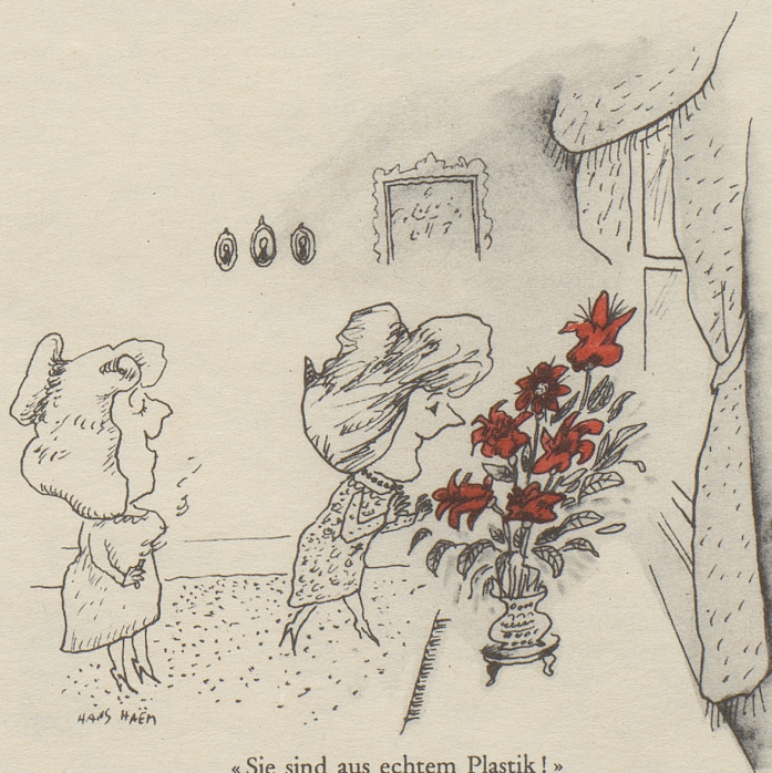
«Sie sind aus echtem Plastik!»

Aber ich begegne meinen Frauen nicht etwa nur tagsüber. Da wurde beispielsweise kürzlich mitten in der Nacht bei uns geschellt. Vor der Türe stand weinend eine junge Frau mit ihrem Kind auf dem Arme. Sie suchte bei mir Schutz, weil ihr Mann sie mit dem Karabiner bedrohte. Mag man mir soziale