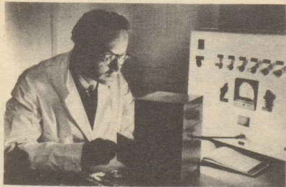
Wissenschaftlich bewiesen: Die Aufbaustoffe von Neo-Silvikrin gelangen bis in die Haarwurzeln!

Bestimmt haben auch Sie schon dies oder jenes unternommen, um den Haarausfall aufzuhalten... und das Ergebnis??? Jetzt endlich brauchen Sie nicht mehr den Mut zu verlieren, denn es gibt ja Neo-Silvikrin — die auf der ganzen Welt anerkannte biologische Haarnahrung! Die erste Voraussetzung für die Wirksamkeit eines Haarpräparates ist: Seine Wirkstoffe müssen bis in die Haarwurzeln gelangen!