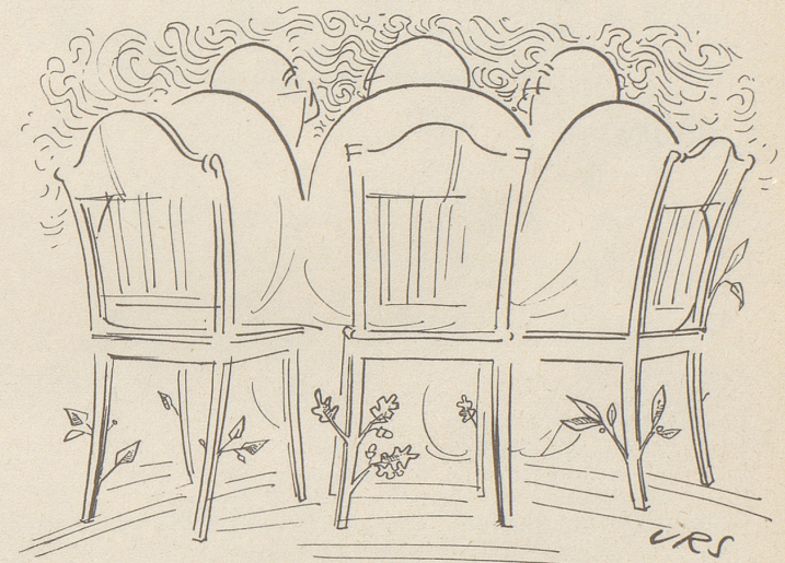
Endlich eine ersprießliche Konferenz!