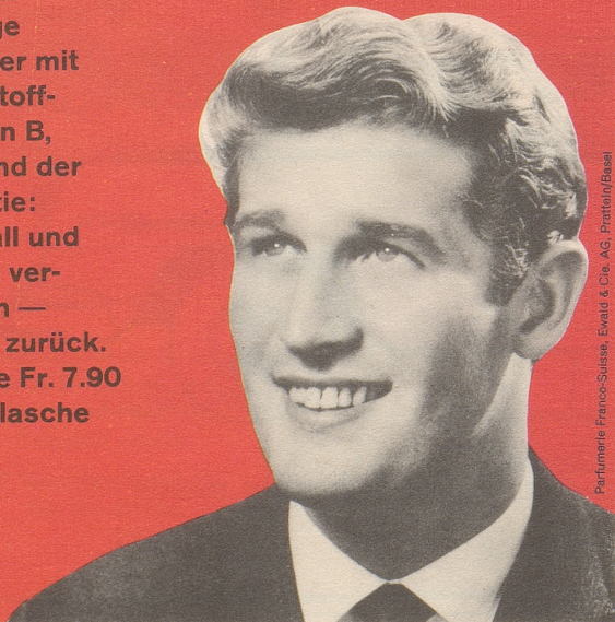
Parfumerie Franco-Suisse, Ewold & Cie. AG, Pratteln/Basel

FS-Brennessel-petrol-Konzentrat - ein Spitzenprodukt vom Fachmann empfohlen! Das einzige Haarwasser mit den Wirkstoff-Komplexen B, F und H und der FS-Garantie: Haarausfall und Schuppen verschwinden — oder Geld zurück. Kurflasche Fr. 7.90 Standardflasche Fr. 5.90