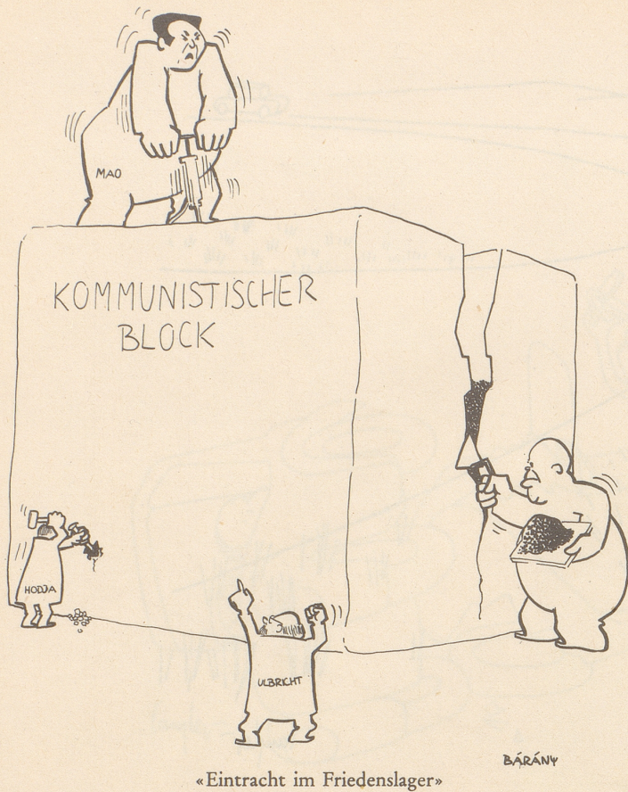
«Eintracht im Friedenslager»