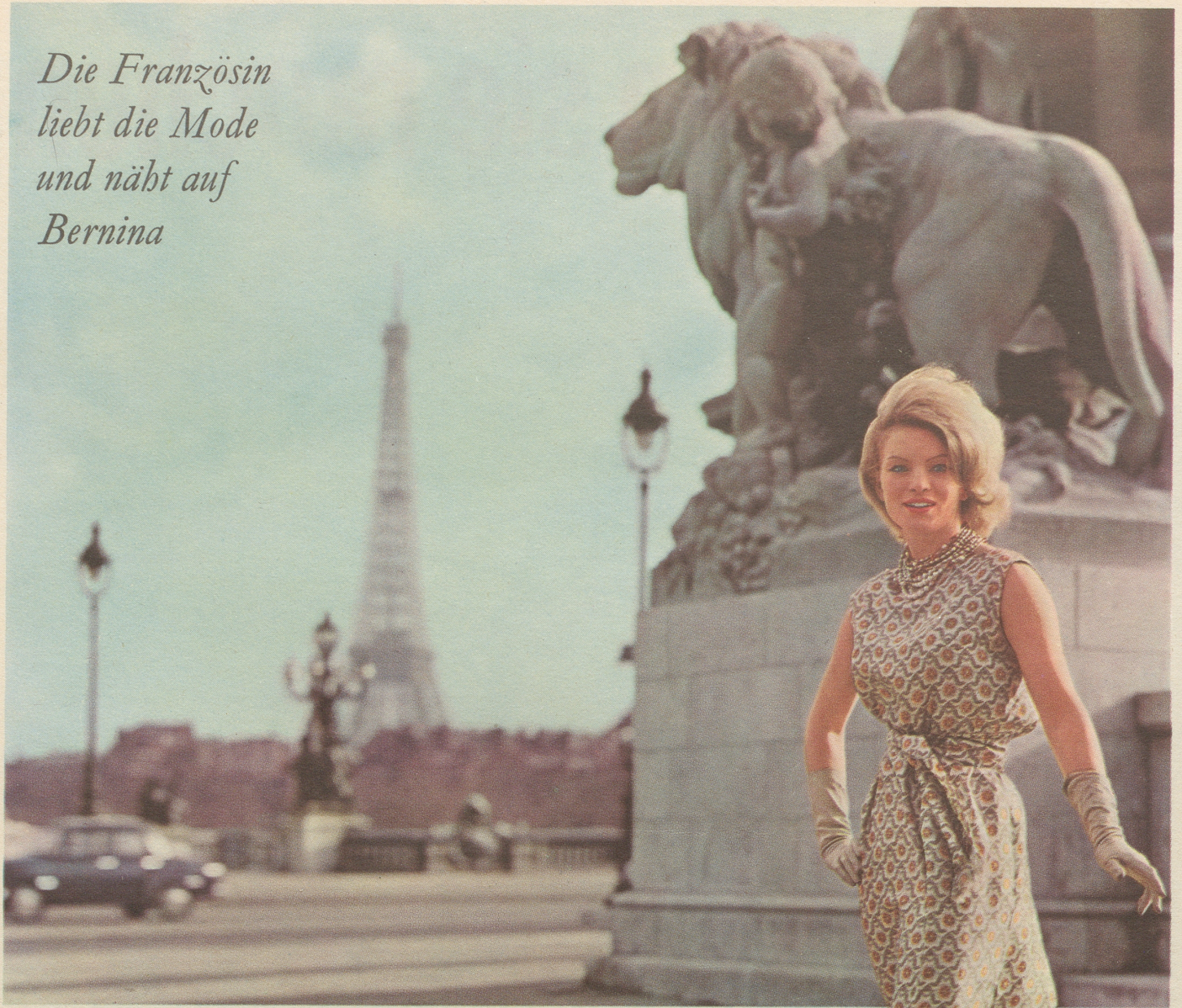
Boulevard-Café in Paris / Begehrt in ganz Frankreich als Qualitätsnämaschine ist BERNINA, die weltbekannte Schweizer Marke.

Die Französin liebt die Mode und näht auf Bernina