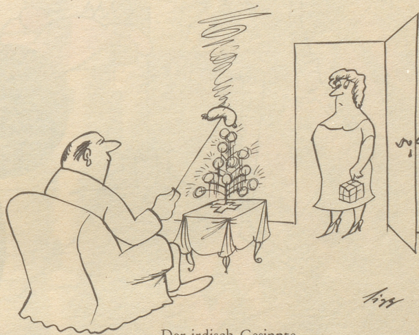
Der irdisch Gesinnte