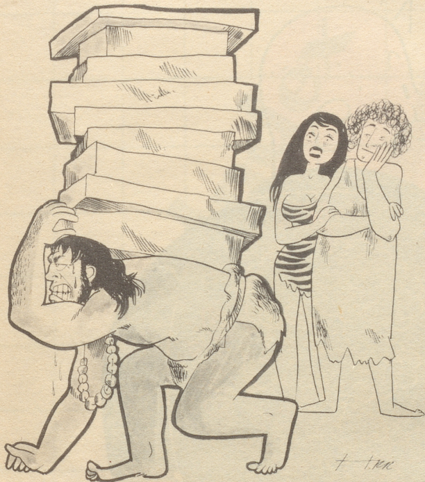
«Bärentatzers nebenan haben wieder eine Menge Neujahrskarten erhalten.»