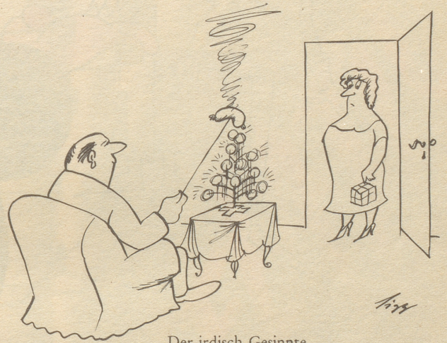
Der irdisch Gesinnte