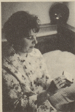
LAEVORAL verschafft rasch neue Kräfte