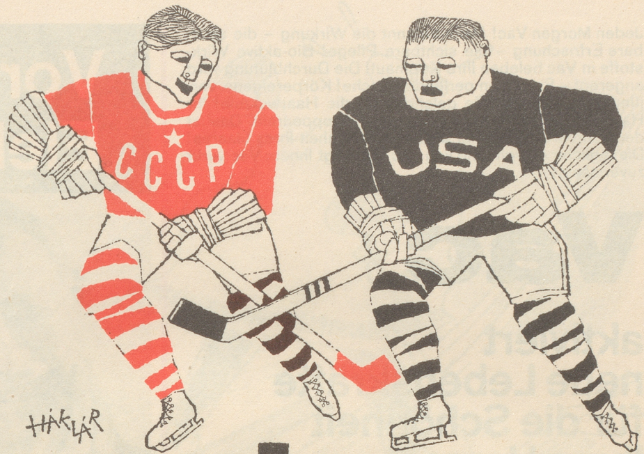
Der kalte Krieg