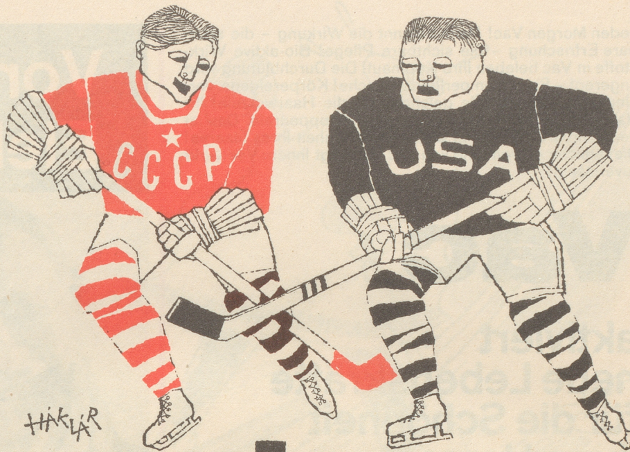
Der kalte Krieg