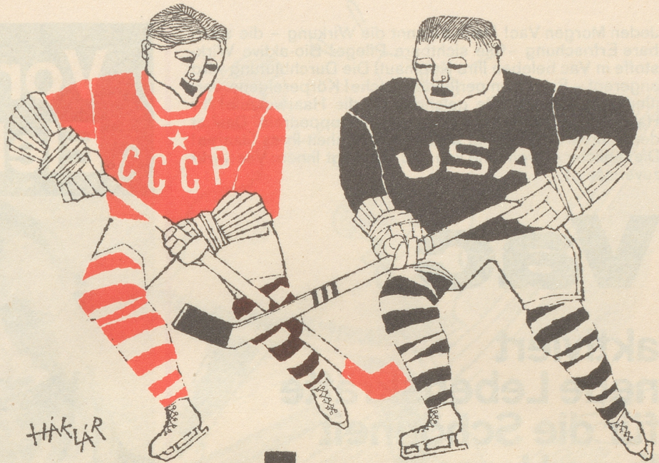
Der kalte Krieg