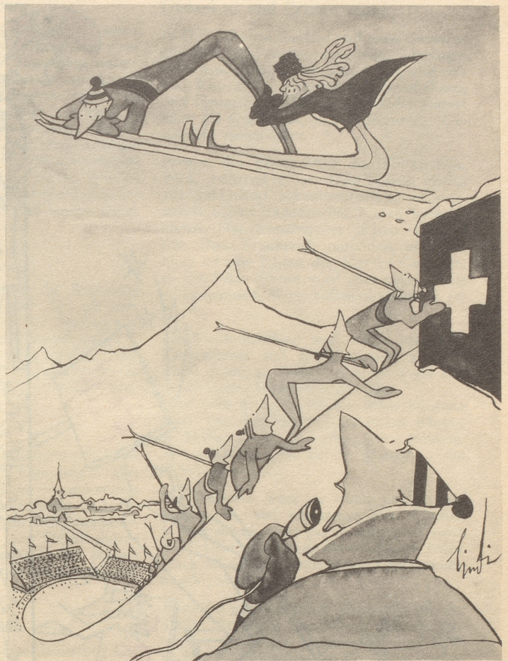
«Prachtvolle Vorlage! Umso bemerkenswerter, als sich seine Braut keine Minute von ihm trennen will.»

Auf dem Flughafen Kloten ist ein Puma im Frachtraum eines Flugzeuges aus seinem Käfig ausgebrochen, aber im Verlaufe mehrerer Stunden wieder eingefangen wor-