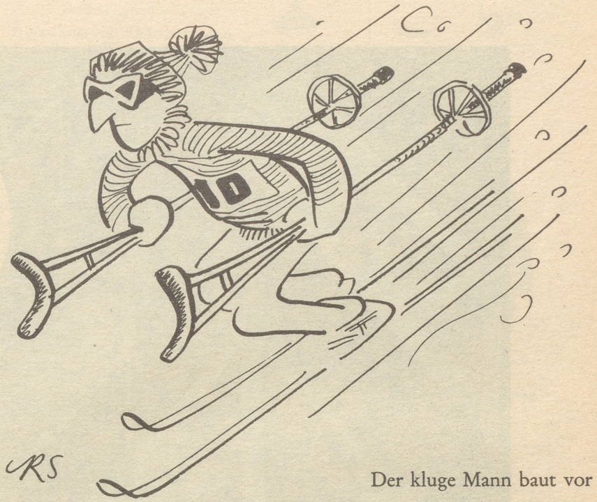
Der kluge Mann baut vor