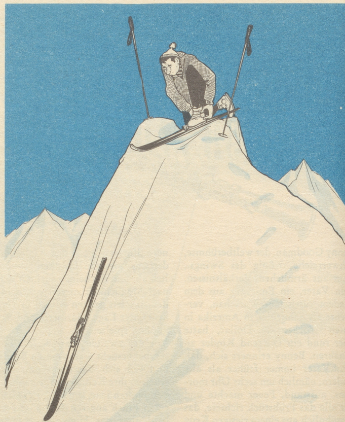
«Halt Heiri, det chunnt ihren Maa, dä hilft ere scho!»