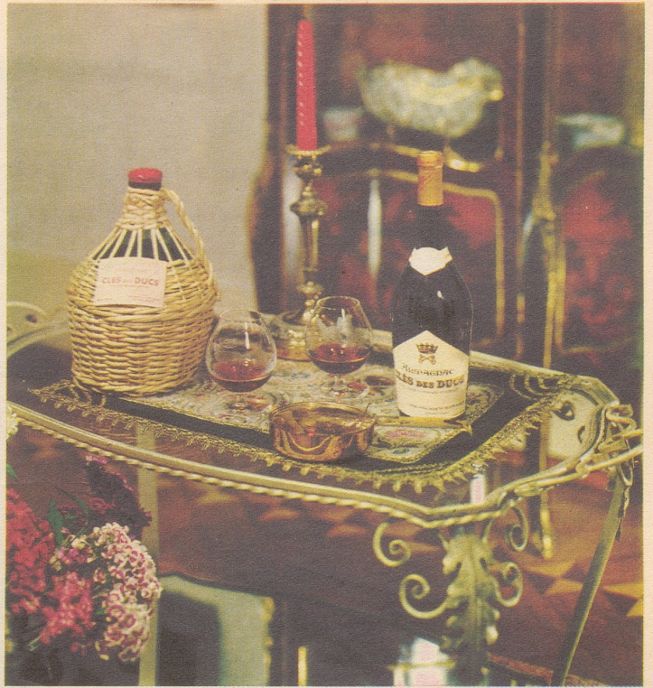
Armagnac CLES DES DUCS

hat Stil und Temperament darum ist er auch der erklärte Favorit soignierter Kenner!