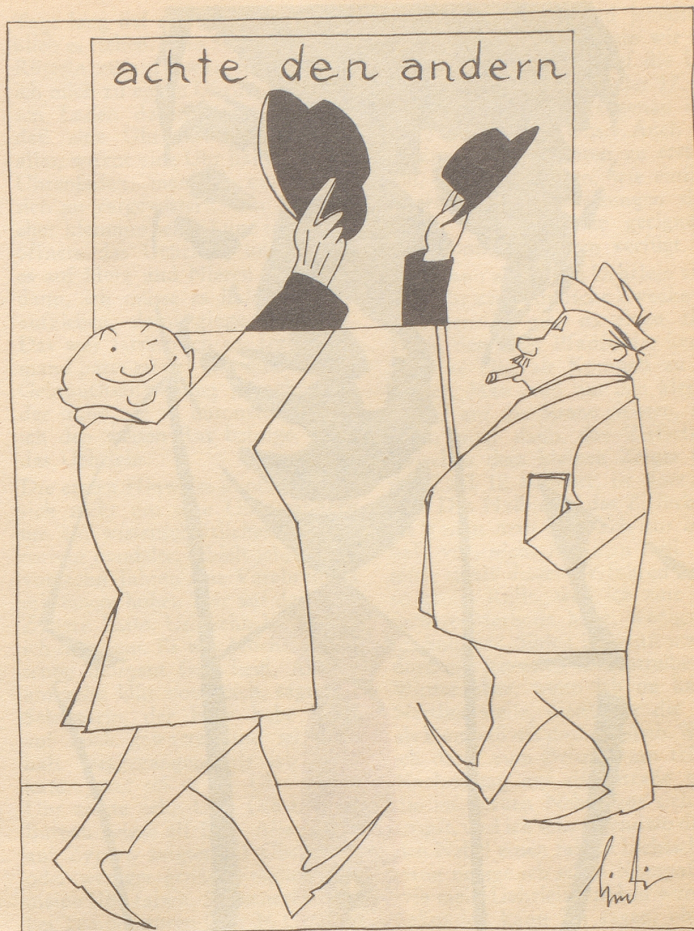
Der Herr rechts: «Settig Hüet hei nume die Mehbessere!»

Bezugsquellennachweis: E. Schlatter, Neuchâtel