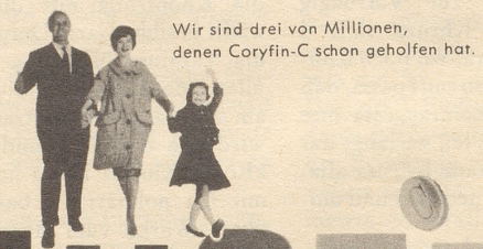
Wir sind drei von Millionen, denen Coryfin-C schon geholfen hat.

Bei Schmerzen hilft Mélabon besonders wirksam gut verträglich