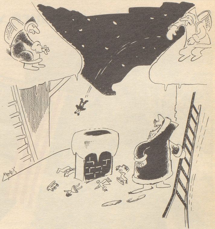
«Jetzt noch jeder drei Würfe — dann müssen wir aber weiter!»

«Nachbarin, Ihr Fläschchen» – vielleicht wäre das Harmlosere doch