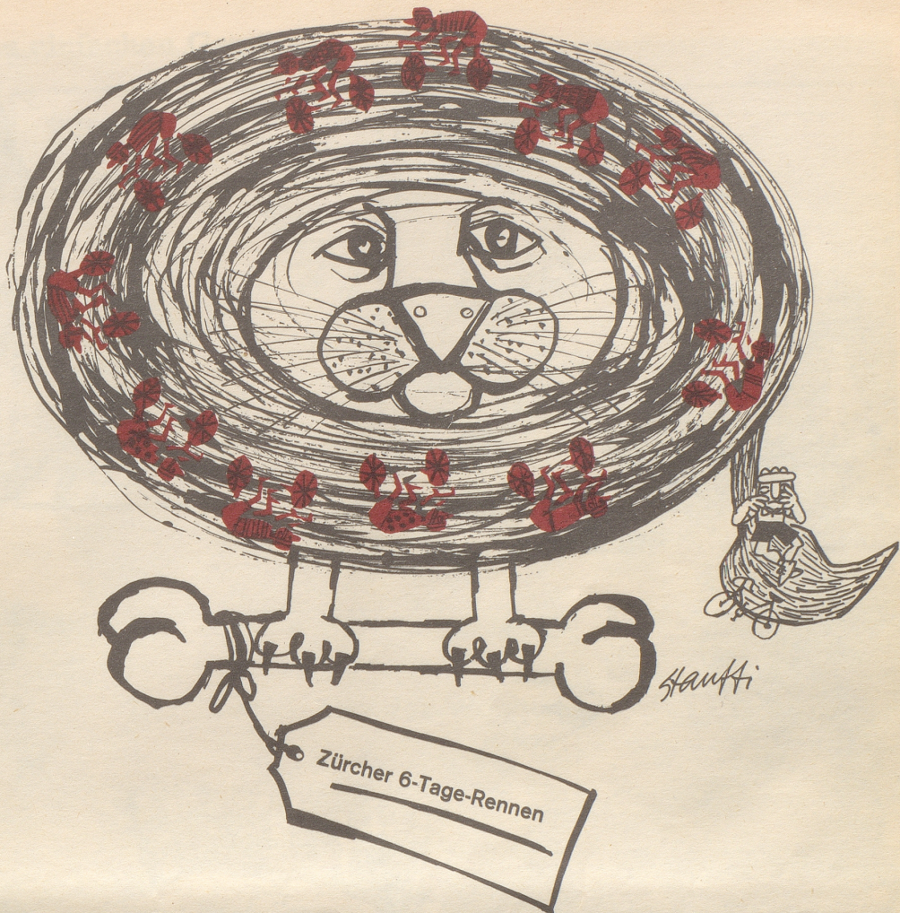
Nun kreisen sie wieder