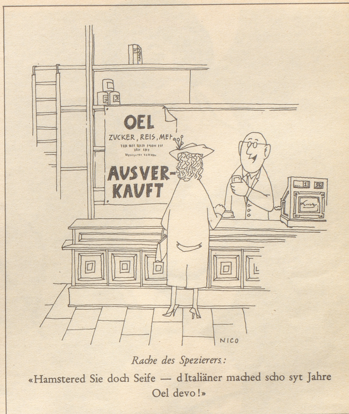
Rache des Spezierers:

«Hamstere Sie doch Seife — d'Italiäner mached scho syt Jahre Oel devo!»