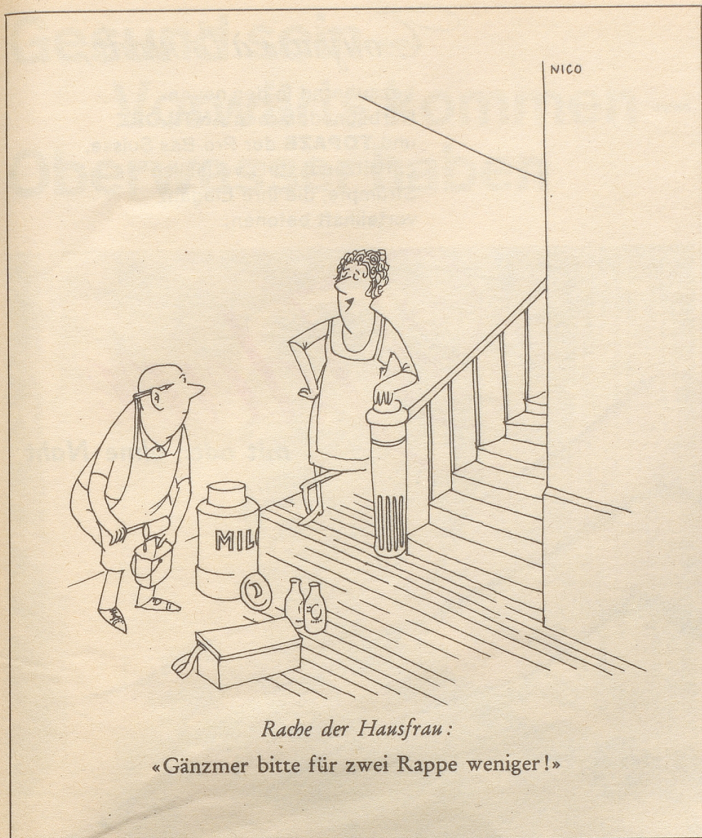
Rache der Hausfrau: