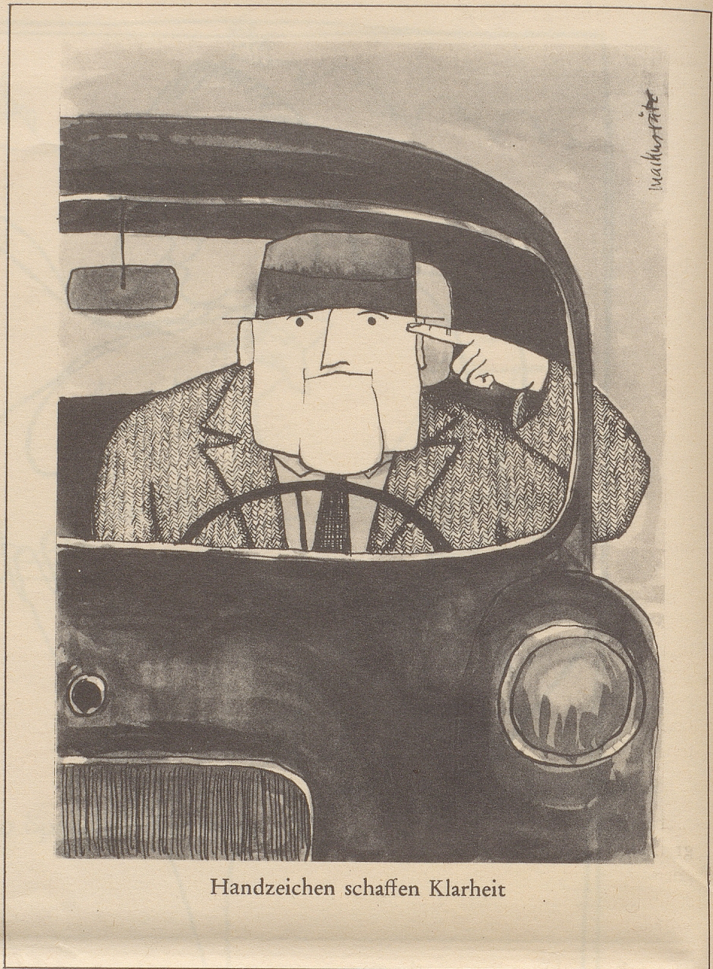
Handzeichen schaffen Klarheit

◀ Pompidou-Regierung gestürzt. Disposition des Pariser Parlamentes für de Gaulle: Pas Bonn! Da