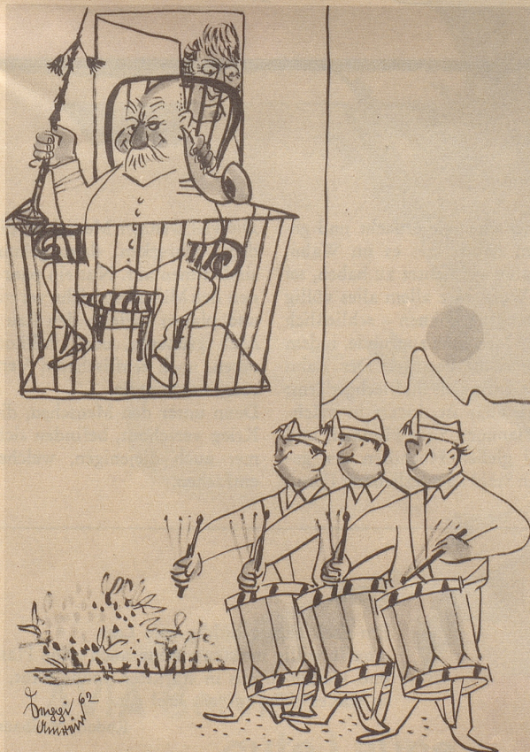
Tambourmajor feiert 95. Geburtstag

In New York gibt es jetzt eine gut florierende Nervenklinik für Hunde. Nach Mitteilungen des Chefarztes der Klinik gibt es in New York zirka 70000 nervenkranken Hunde. Die Hauptursachen der Nervenleiden seien: Ehekrach, Verkehrslärm, Jazzmusik und Fernsehen. TR