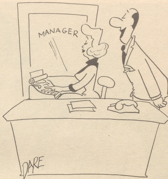
Geduld mit Anfängerinnen

«Prima, das Q sitzt schon ganz gut, jetzt gehen wir zum W über.»