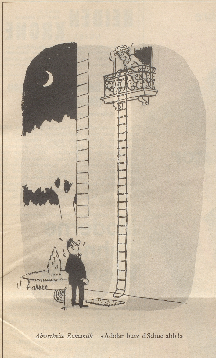
Abverheite Romantik «Adolar butz d Schue abb!»