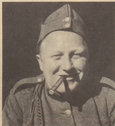
W.K. 1962. — Warten und pressieren können mich nicht aus der Ruhe bringen, wenn ich E3 oval rauche.

der Stumpfen, der so gut im Munde liegt. Sie empfinden seine Form als besonders mundgerecht.