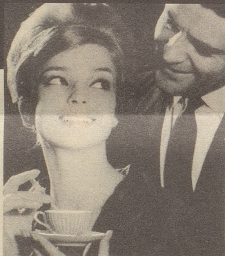
Ich verwende jetzt eben Pepsodent