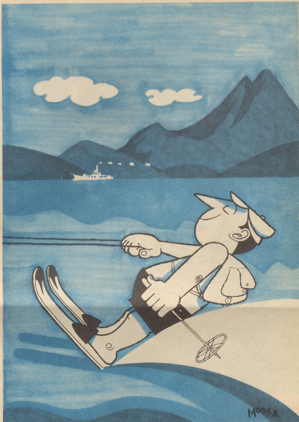
Europa-Wasserski-Meisterschaften in Montreux 3.-11. September 1962