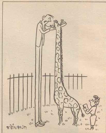
«... Karies, drei, links, unten...»

Als Pendant zur Jazzfibel liegt nun auch eine «Filmfibel» vor. Sie enthält die mannigfachsten Vorzüge: eine klare, einfache, farbige Sprache, ein treffliches Einfühlungsvermögen in die Problemwelt der Jugendlichen, ein hohes Maß der Veranschaulichung abstrakter Gegebenheiten, vor allem aber eines – die Begeisterung für den Film! Man müsste zwar genauer sagen: für den guten Film. Knobel rechnet auf lebenswürdig-entschiedene Weise mit dem Allerwelts-Streifen, mit der larmoyanten Schnulze und mit der gefühluseligen Schwärmerei für sogenannte Filmstars ab, jedenfalls mit den falschen. Seine Fibel eröffnet den Filmbegeisterten eine Welt der harten Arbeit, in der sich Darstellungskunst, photographische Meisterschaft und die schöpferische Begabung eines Regisseurs zur hohen Leistung verbinden. Wir glauben, die unverhüllte Absage an das minderwertige Filmprodukt werde manche Teenager und Halbwüchsige zunächst wärschaft stutzig machen. Darin liegt aber exakt der Wert und das Ziel der Fibel. Und weil diese Abrechnung ohne die tiefende Gebärde des Moralisten auskommt, darf man ihr ein rückhaltloses Lob spenden.