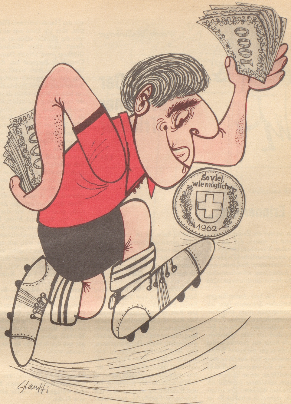
Diese Art Fußball ist auch bei uns nicht ganz unbekannt

Nein - wenn Monmouth College in Vergangenheit und Zukunft sich nichts Aergeres vorzuwerfen haben sollte als diese Verleihung, glauben wir doch, daß beiden Seiten dazu gratuliert werden darf. Pietje