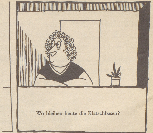
Wo bleiben heute die Klatschbasen?