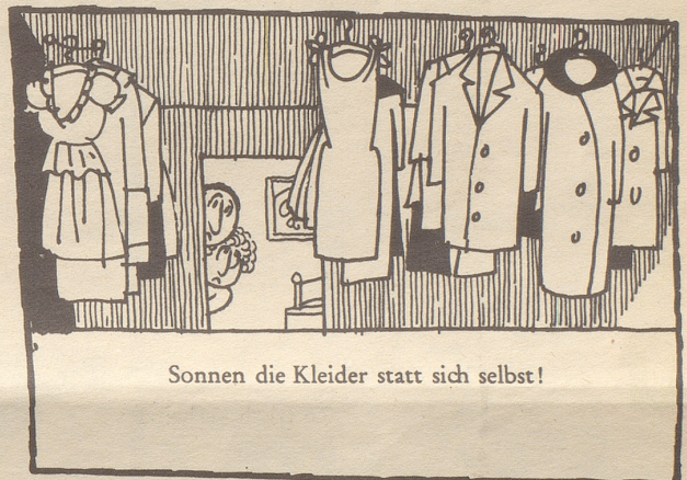
Sonnen die Kleider statt sich selbst!