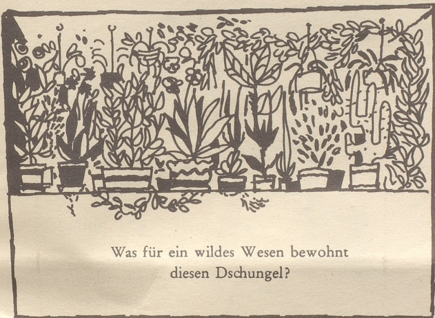
Was für ein wildes Wesen bewohnt diesen Dschungel?