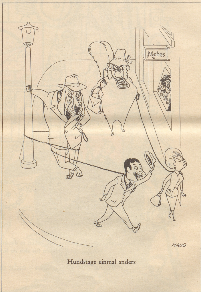
Hundstage einmal anders