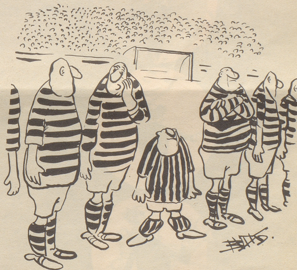
«Er sagt, Längsstreifen machen ihn größer!»

Sie auf unsere Treppenstufe auf!» Beim Ausgang dann: «Passen Sie auf Ihre Zunge auf!» Beim Ausgang irgendwo: «Bitte Tür leise schließen, auch wenn Ihr Antrag abgelehnt worden ist!» Beim Kasseingang des Steueramtes im schwarzwäldischen Freudenstadt: «Grüß Gott, tritt ein, bring Geld herein, es wird zum Nutzen aller sein.» Im Steueramt Nürnberg unter dem Bild eines Mannes, der mit der einen Hand nimmt und mit der andern gibt, das lateinische Zitat: «Do ut des.» Also: «Ich gebe, damit auch du wieder gibst.» Und in der Eingangshalle des Finanzamtes Frankfurt-Höchst Goethes