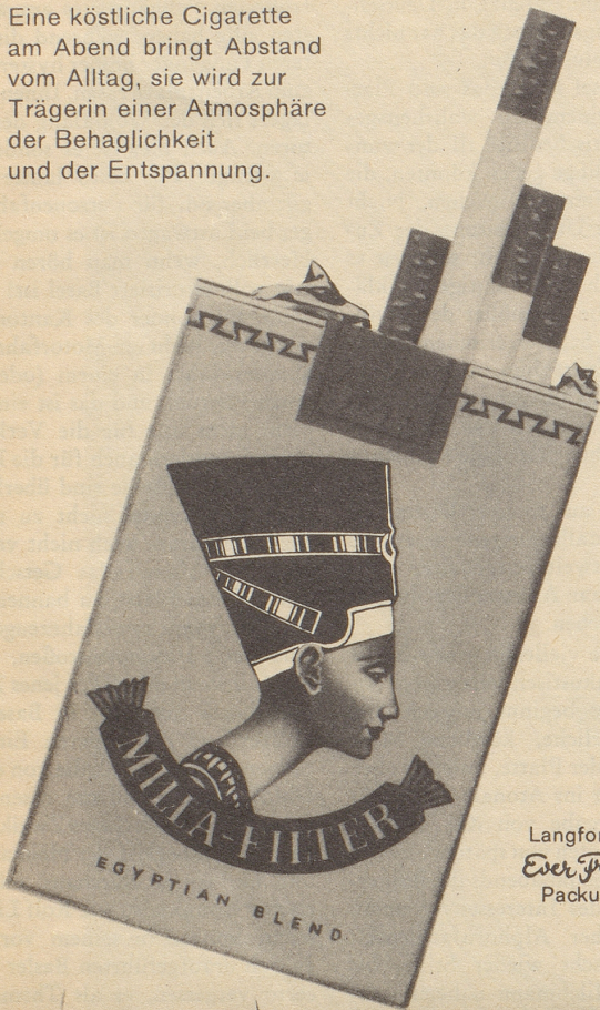
Langformat Ever Fresh Packung

Eine köstliche Cigarette am Abend bringt Abstand vom Alltag, sie wird zur Trägerin einer Atmosphäre der Behaglichkeit und der Entspannung.