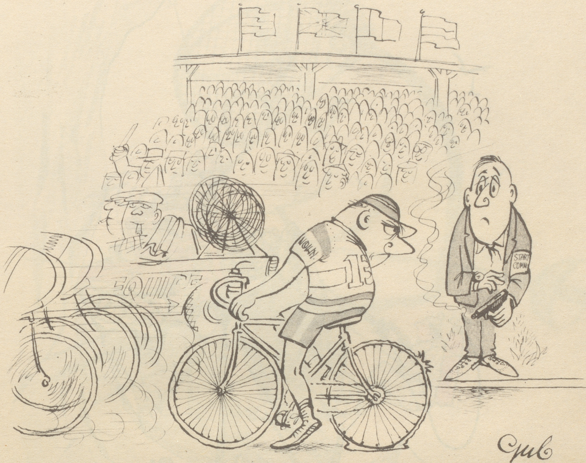
Der linksche Startschießer