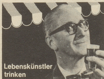
Appenzeller Alpenbitter – jetzt gespritzt!

Und das gedacht: Hoffentlich erinnern sich die Damen jeweils des vergessenen Hütchens, ehe sie ein zweites aufsetzen ... Kobold