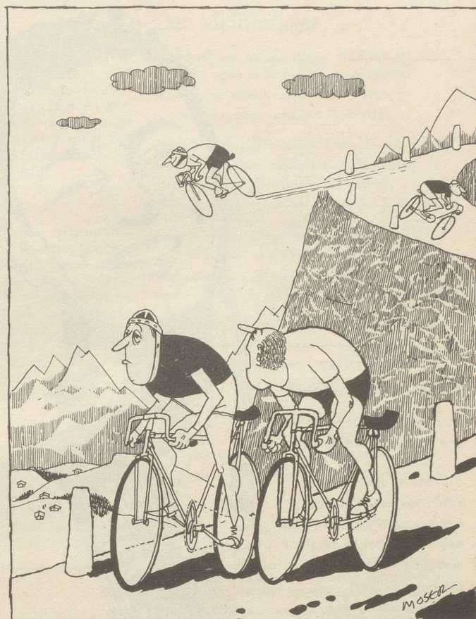
«Das ist ein früherer Bahnspezialist und Schweizermeister im Fliegerrennen! Man nannte ihn den Düsenjäger ...»

Als der Maler Ferdinand Hodler endlich finanziell auf einen grünen Zweig kam, standen langjährige Gewohnheit und angeschlagene Gesundheit einem üppigeren Lebenswandel im Wege. »Man kann halt nicht nachessen«, sagte Hodler melancholisch. fh