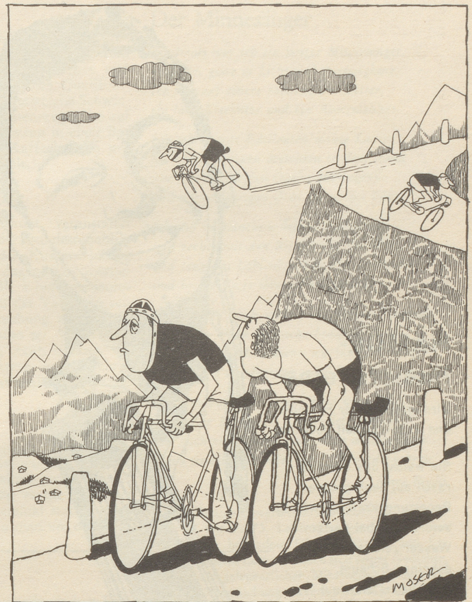
«Das ist ein früherer Bahnspezialist und Schweizermeister im Fliegerrennen! Man nannte ihn den Düsenjäger ...»

Als der Maler Ferdinand Hodler endlich finanziell auf einen grünen Zweig kam, standen langjährige Gewohnheit und angeschlagene Gesundheit einem üppigeren Lebenswandel im Wege. »Man kann halt nicht nachessen«, sagte Hodler melancholisch. fh