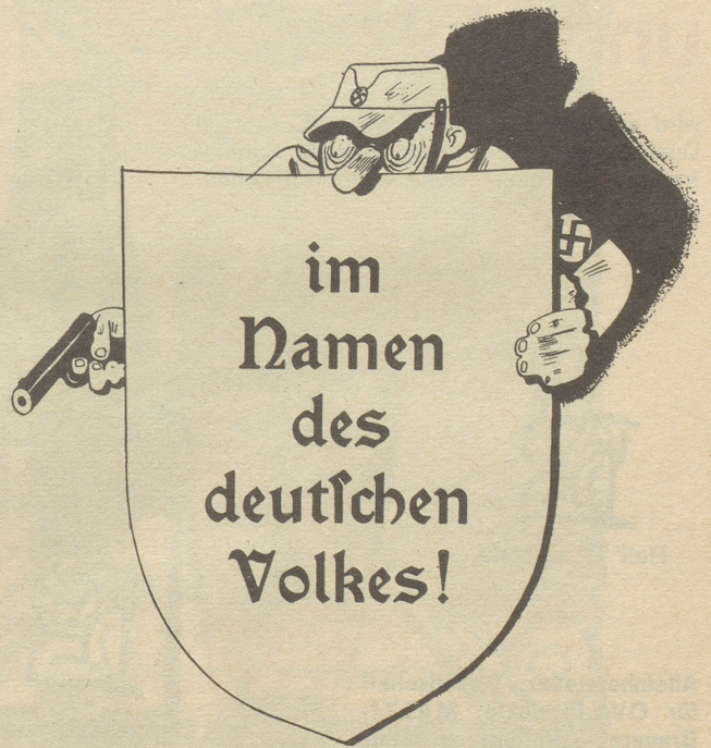
Das gute Schild hinter dem sich die Machthaber des Dritten Reiches verschanzen.