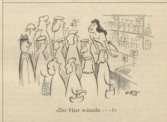
«Der Herr wünscht - - -?»

hoch angesehen war, sie solle doch zu Hof gehn, um ein gutes Beispiel zu geben.