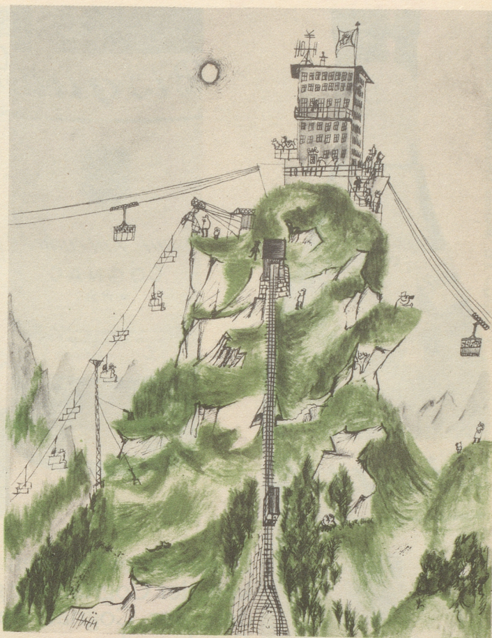
Wo Berge sich überheben - - -