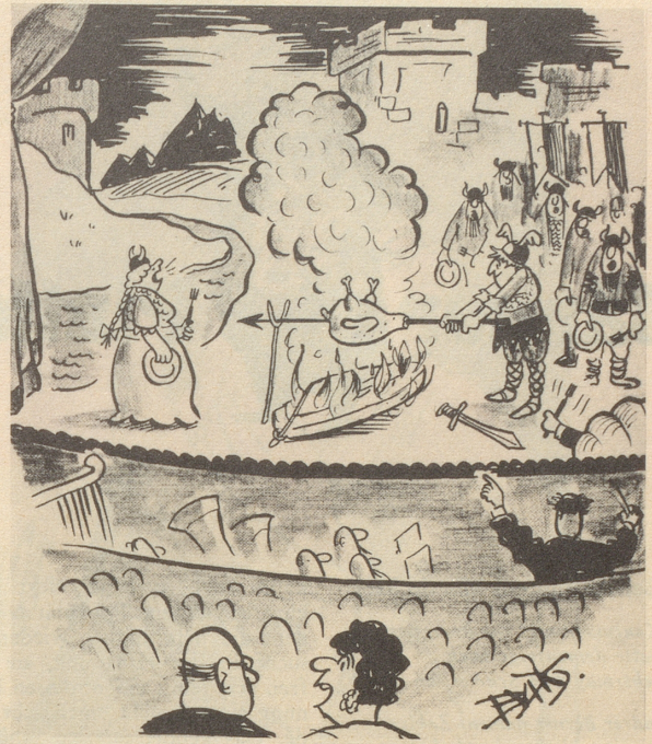
«Es ist die letzte Lohengrin-Vorstellung der Saison, sie brauchen nun den Schwan nicht mehr!»

Dem gescheiten kleinen Druckfehlerteufel des «Alg. H'blad», der uns zu dieser kleinen Exkursion ins sogenannte «liberalisierte» Polen Gelegenheit gab, ein dank je wel! Um aber doch nicht ganz ohne Perspektiven zu endigen: Jenen Freunden in Polen, die gefangen hinter vergitterten Fenstern oder außerhalb der Eisenstäbe in steter Bedrängnis leben müssen, sich vergeblich nach einer Freiheit sehndend, in der ständig zu atmen, die unangestastet und gesichert zu besitzen wir das Glück haben ... jenen Freunden (die nichts mit den Verrätern am polnischen Volk gemein haben wollen, die, von einem Gomulka gesandt, unter allerlei Vorwänden bei uns im Westen herumlungern) ... ihnen rufen wir zu: Noch ist Polen nicht verloren .. trotz Gomulka, trotz PPR, trotz der Sowjetunion .. weil es euch gibt, Ihr Tapferen! Wir danken euch! Pietje