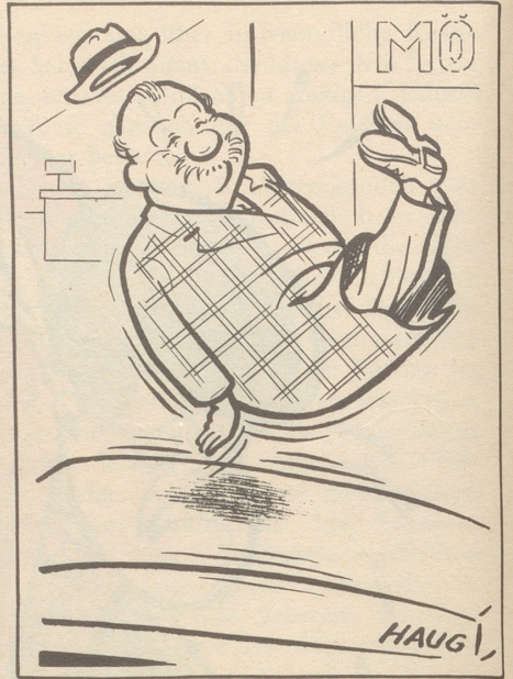
Die elastische Matratze und das Kind im Manne