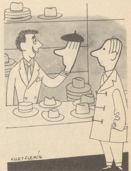
«Sehen Sie, so wird Ihnen diese Mütze stehen!»

Erich Mende als dritter Mann am Verhandlungstisch, das war das Ziel der Krämpfe während der Koalitionsverhandlungen. Aber dieser Traum war schnell ausgeräumt. Adenauer nahm nur seine beiden engsten Berater Schröder und Strauss mit.