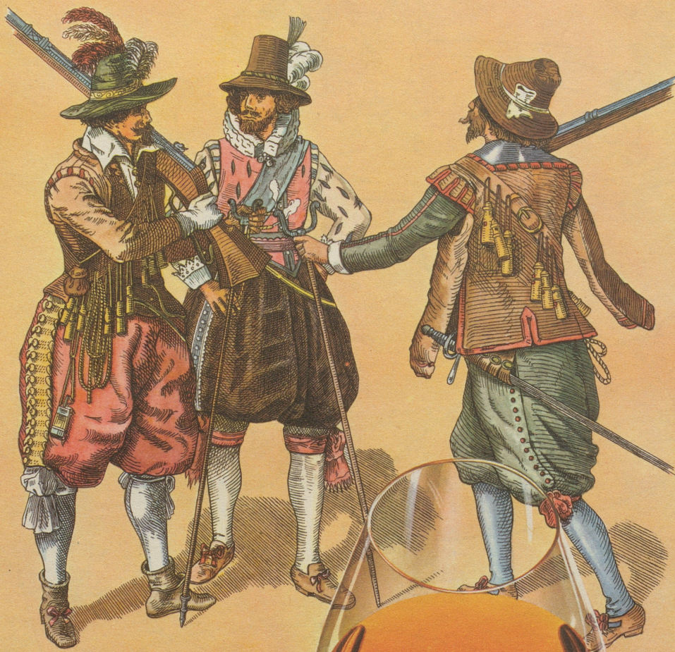
Schützen, um das Jahr 1638

macht das Wetter was es will», sagt ein altes Sprichwort. Vielleicht aber auch nur, weil es sich reimt! Stimmt es aber doch einmal und regnet es draußen in den schönsten Frühling hinein, so warten wir halt drinnen bis es aufhört. Und das Warten wird uns erleichtert durch die sonnigen Farben eines prachtvollen Orientteppichs von Vidal an der Bahnhofstraße 31 in Zürich. Orientteppiche bringen Sonne in Ihr Heim!