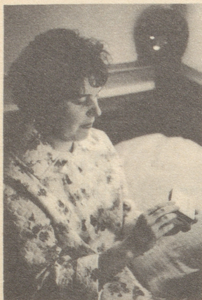
LAEVORAL verschafft rasch neue Kräfte

wertvoller Energiespender für Automobilisten