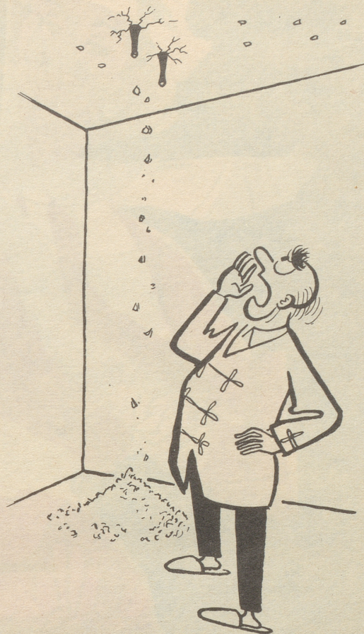
Die neue Mieterin mit den Bleistiftabsätzen