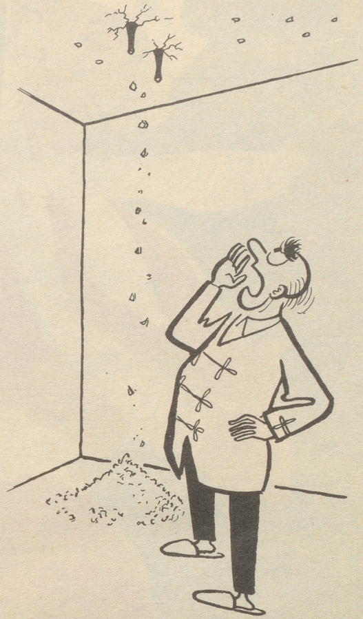
Die neue Mieterin mit den Bleistiftabsätzen