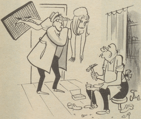
«Sie sind jetzt unsere letzte Hoffnung, Meister!»