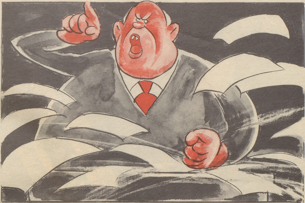
«Der afrikanische Märtyrer Lumumba — wo ist er!??»