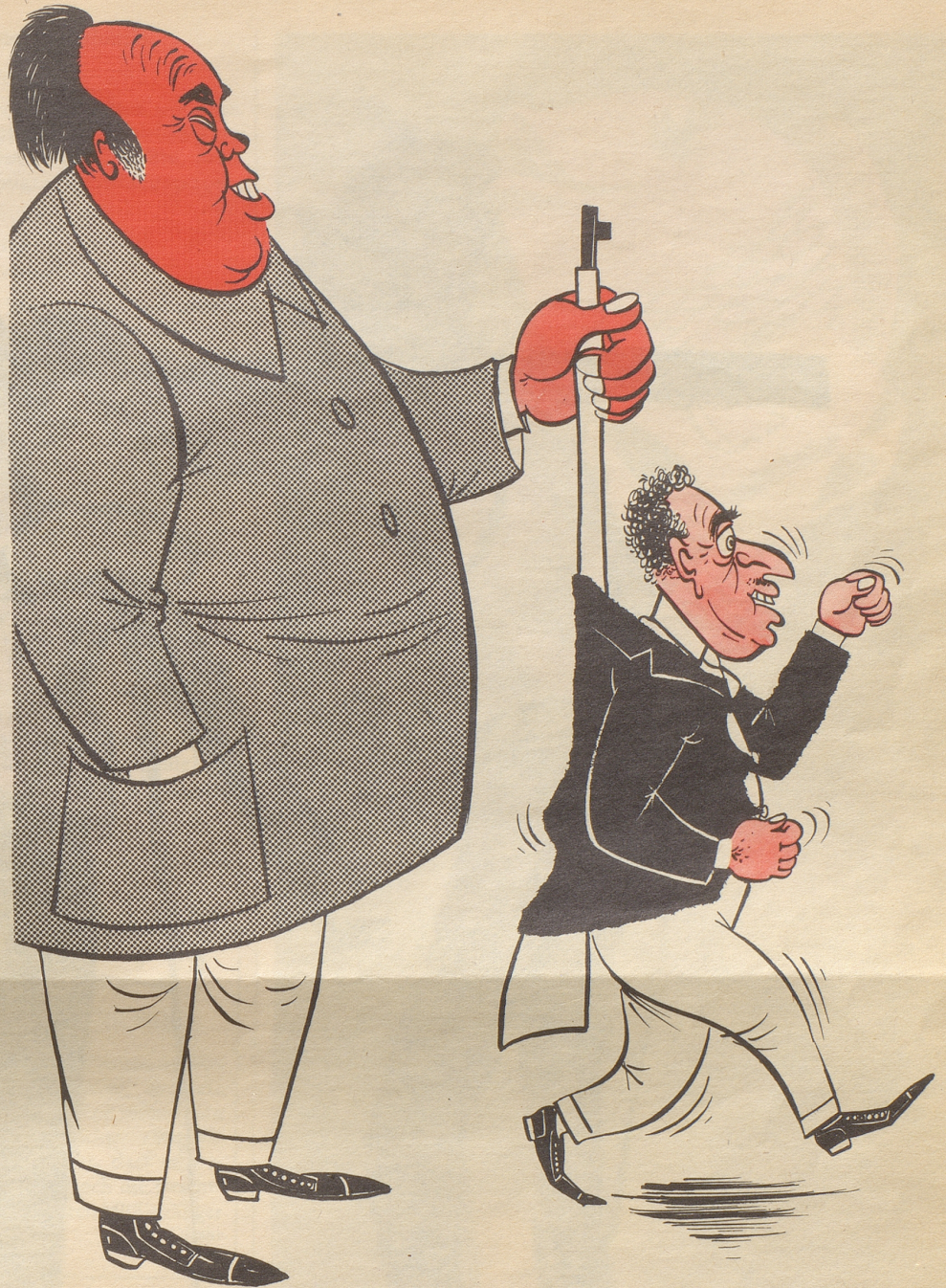
Rückenstärkung für Ferhat Abbas