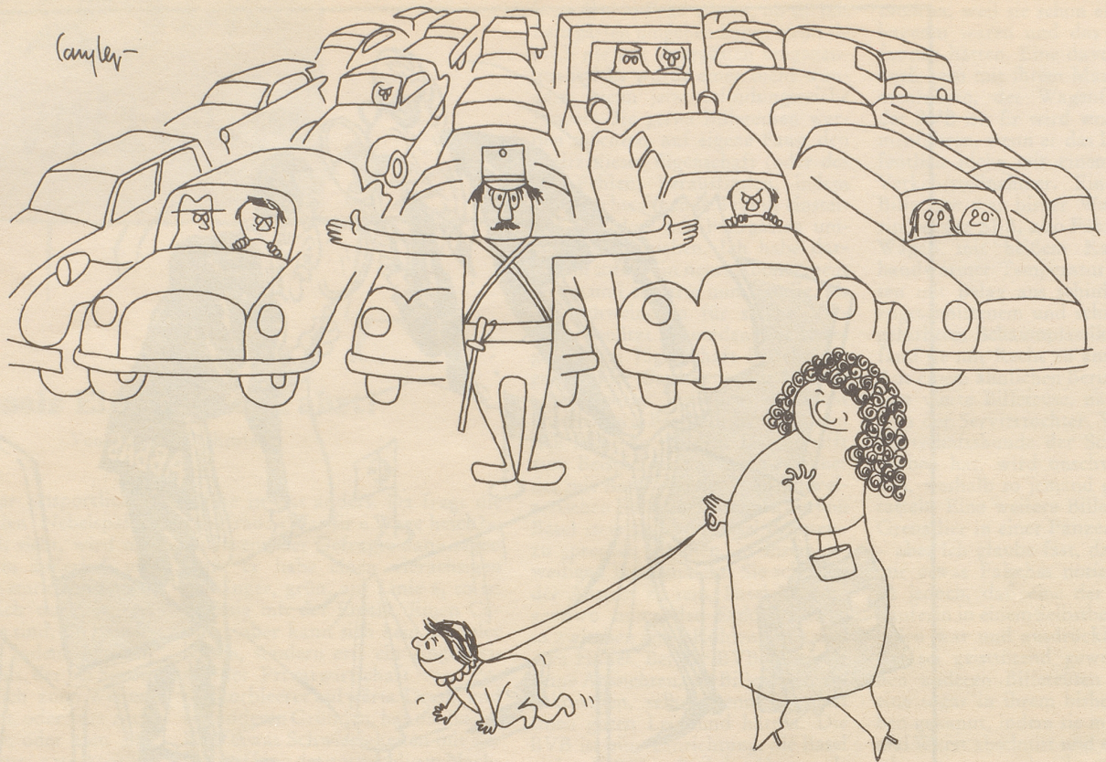
Amene Hundli zlieb haltets